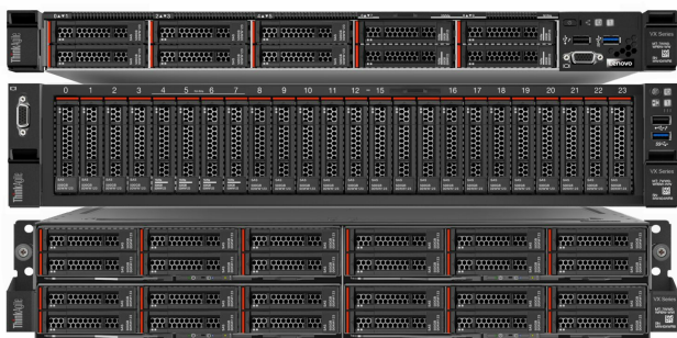
Модели серии VX выше: VX3320 сверху, VX7520 посередине и VX3720 снизу