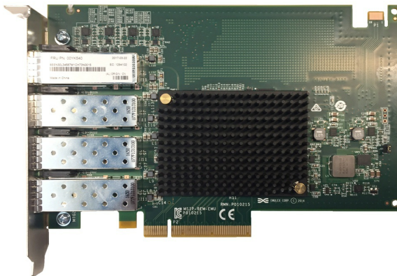
Figure 3. ThinkSystem Emulex OCe14104B-NX PCIe 10Gb 4-Port SFP+ Ethernet Adapter

The following figure shows the ThinkSystem Emulex OCe14104B-NX PCIe 10Gb 4-Port SFP+ Ethernet Adapter.