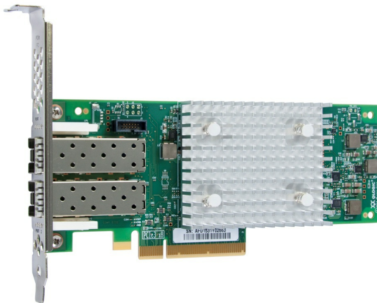
Figure 1. ThinkSystem QLogic QLE2742 PCIe 32Gb 2-Port SFP+ Fibre Channel Adapter (shown without the included 32 Gb transceivers)

The QLogic QLE2742 2-port 32 Gb Fibre Channel HBA is shown in the following figure.