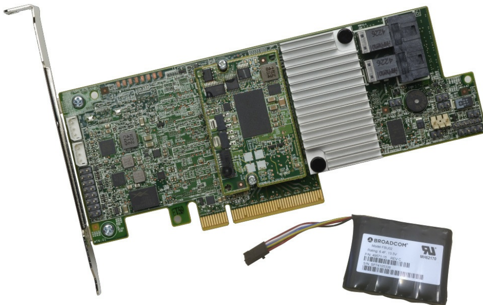
Figure 2. ThinkSystem RAID 730-8i 2GB Flash PCIe 12Gb Adapter

The following figure shows the ThinkSystem RAID 730-8i 2GB Flash PCIe 12Gb Adapter with the included external power module.