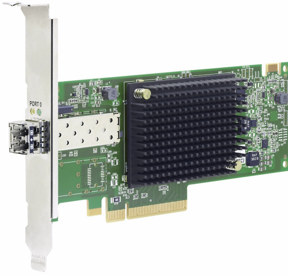
Figure 2. ThinkSystem Emulex LPe35000 32Gb 1-port PCIe Fibre Channel Adapter

The following figure shows the ThinkSystem Emulex LPe35000 32Gb 1-port PCIe Fibre Channel Adapter.