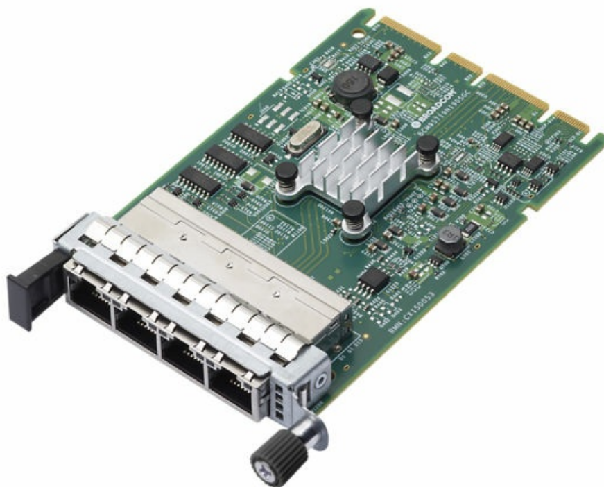
Figure 2. ThinkSystem Broadcom 5719 1GbE RJ45 4-port OCP Ethernet Adapter

The following figure shows the Broadcom 5719 1GbE RJ45 4-port OCP Ethernet Adapter.